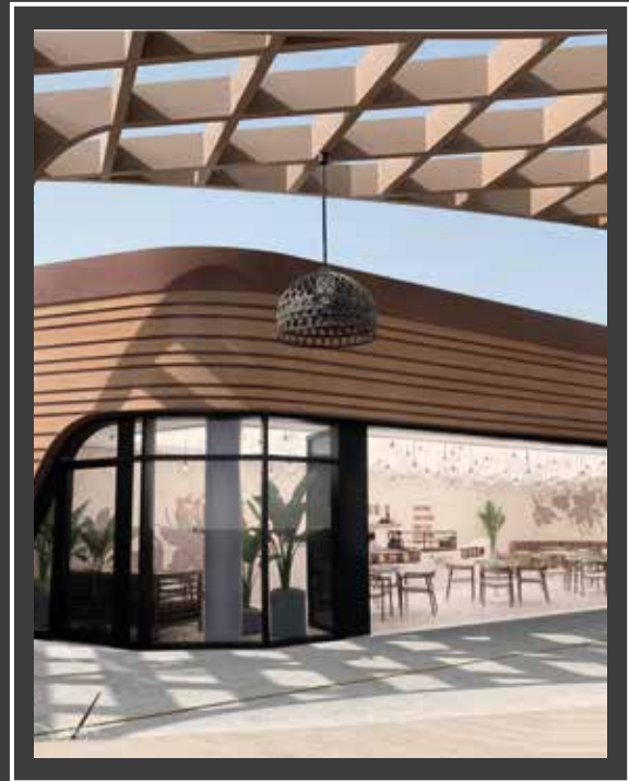
شاطئ الحيرة الشارقة