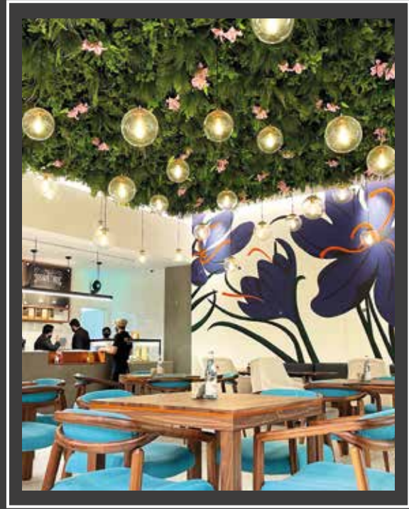
سي تي سنتر الزاهية الشارقة