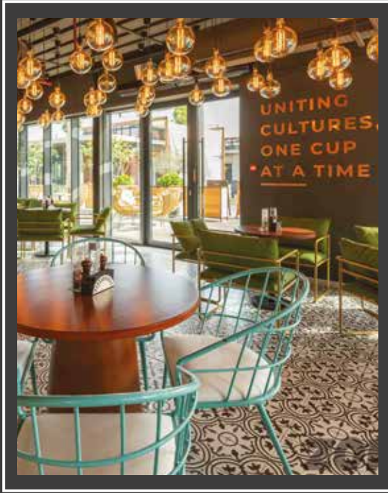
لا مير نورث دبي